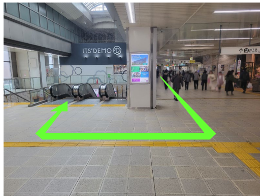
② ファミリーマート前でUターン エスカレーターで下る