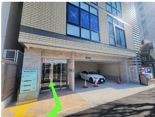
⑧ クリニックの玄関に入り 左側のドアフォンで呼び出す