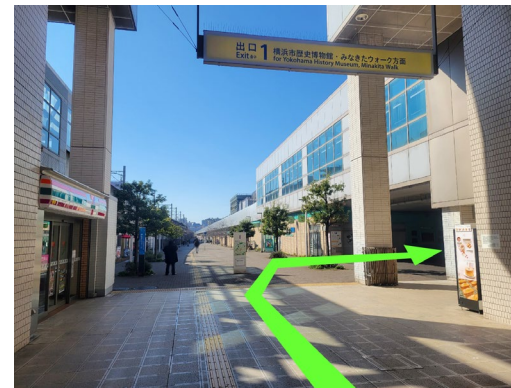
④ 「出口1」左側にセブンイレブン 右折して線路下をくぐる