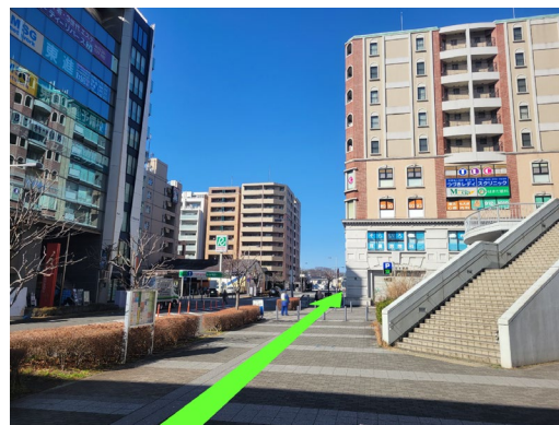
⑤ 車道右側の歩道を 「区役所通り」まで直進150m