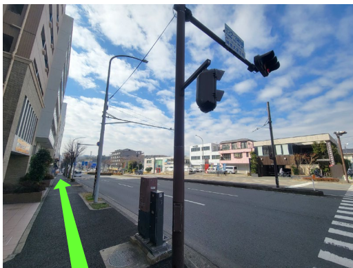
⑦ 車道左側の歩道を 焼肉屋の手前まで直進50m