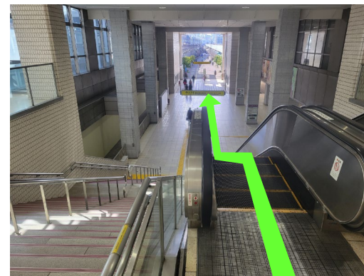
③ エスカレーターで路面まで下る 「出口1」まで直進