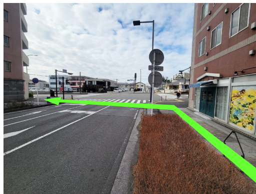
⑥ T字路「センター北駅西側」で 「区役所通り」を渡らず、左折